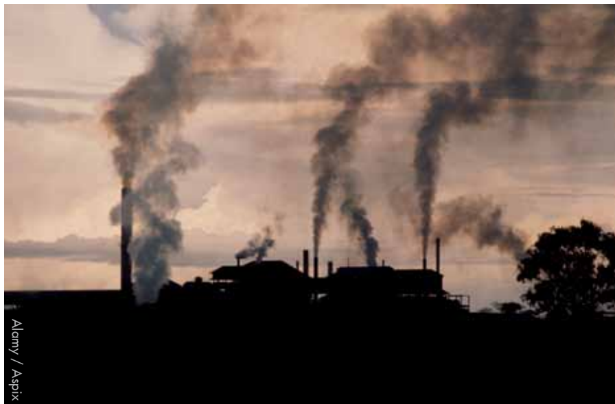
Une fonderie de plomb à Kwabe en Zambie

s'intéresse beaucoup aux questions environnementales et on s'en inquiète.