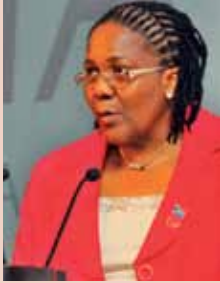
Elizabeth Dipuo Peters Ministre de l'énergie de la République sud-africaine

Actuellement, environ 75 % des ménages « formels » ont accès à l'électricité, contre 30 % en 1994. Capacity.org s'est entretenu récemment avec la ministre de l'énergie de l'Afrique du Sud, Mme Elizabeth Dipuo Peters, qui a expliqué que le succès de son pays et son aptitude à répondre à ses besoins d'énergie est le résultat de l'approche intégrée du développement humain selon laquelle l'énergie est considérée comme un droit fondamental et un catalyseur permettant d'atteindre des objectifs sociaux, économiques et politiques de plus vaste portée. S'agissant des enseignements que pourraient en tirer d'autres pays africains, elle a souligné le rôle des initiatives régionales et internationales pour doter l'Afrique du Sud de la capacité « d'attraper la vague écologique ».