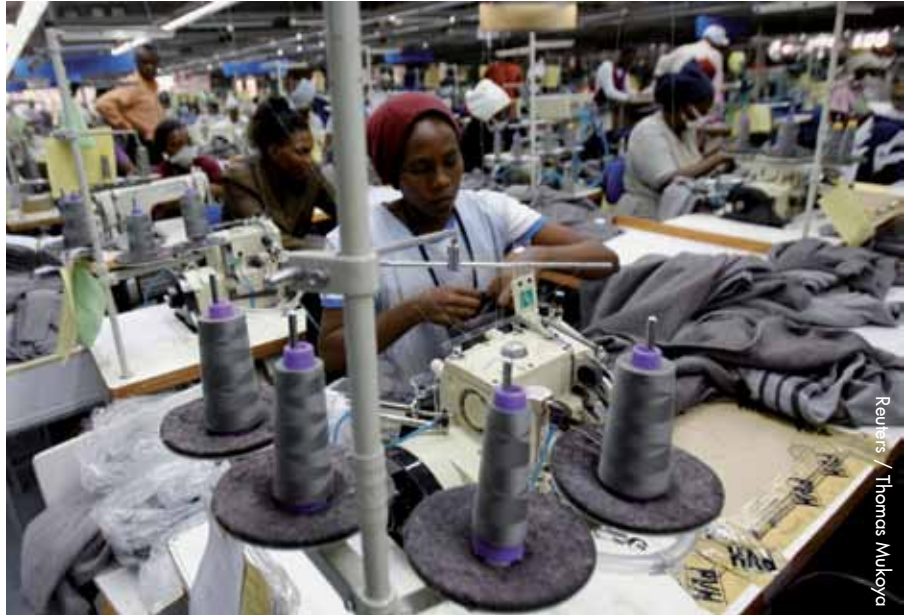
Usine Alltex, Athi River, Kenya

qui souhaitent se tourner vers l'extérieur. Pour nous, la DI reste une ressource clé pour échanger des connaissances sur les marchés communs en Europe.