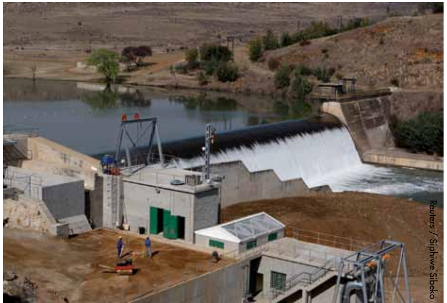
Petite centrale hydroélectrique près de Bethlehem en Afrique du Sud

Nous devons nous tourner vers toute la gamme des institutions du continent et examiner comment elles peuvent se spécialiser, au lieu de dupliquer les ressources.